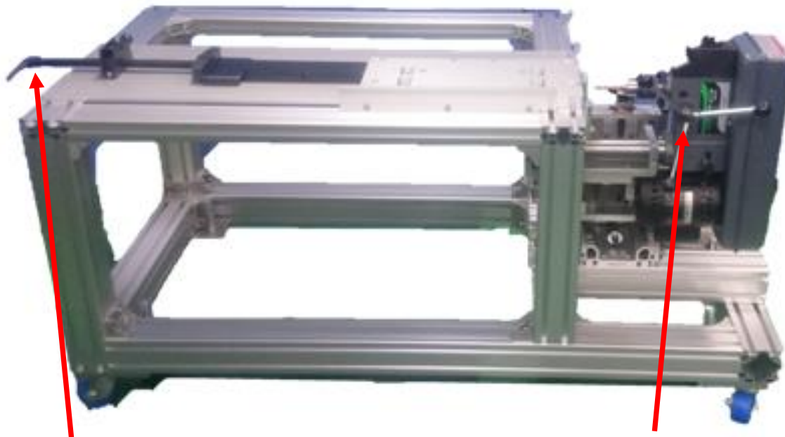
ハーフナット構造のバイス